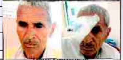
Portrait Photo Poreop Kestop